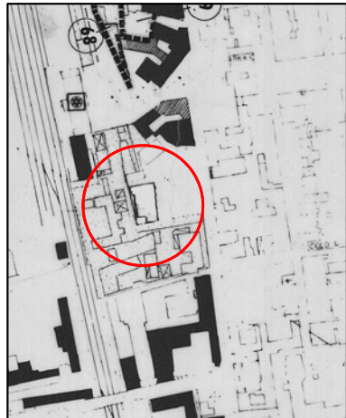
Estratto di P.R.G.C. Tav. 11/1 Scala 1:2000