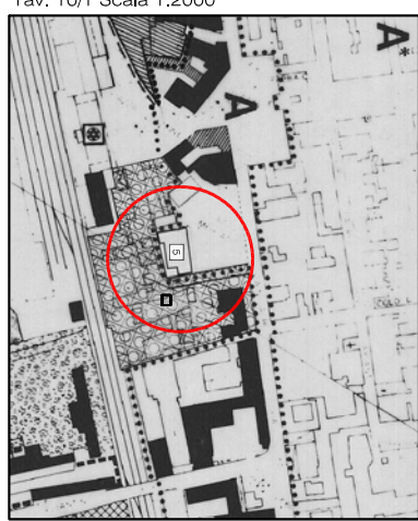
Estratto di P.R.G.C. Tav. 10/1 Scala 1:2000